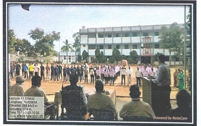
उद्देश पत्रिकेचे वाचन करताना उपस्थित विद्यार्थी